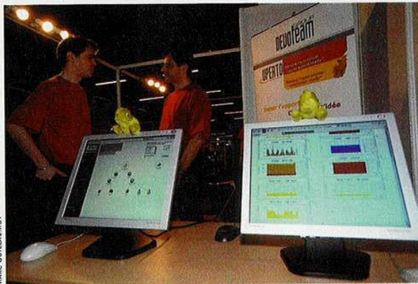
Devoteam a réuni en octobre dernier quelque quarante personnes compétentes en Open Source dans une entité nommée Uperto. Exposant pour la première fois cette année sur le salon, la société estime avoir un positionnement unique, entre SSLL et grosse SSII.